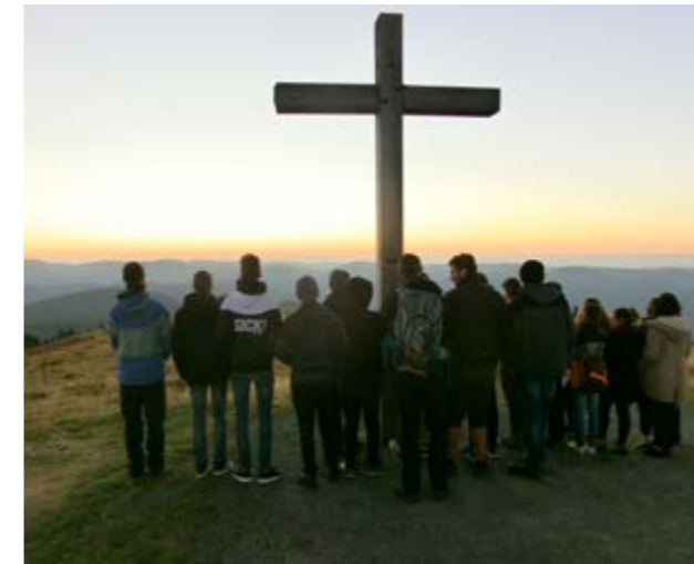
Gespanntes Warten auf die ersten Sonnenstrahlen

Punkt sichtbar: Der erste Sonnenstrahl. Wir lagerten unterhalb des Gipfelkreuzes und begrüßten bei Tee und Frühstücksbroten den neuen Tag.