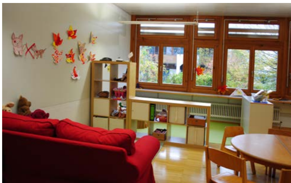
Schulkindergarten Tüllinger Höhe, Gruppe Seepferdchen

Im Januar 2017 hatte der Verein für Heilpädagogik Lörrach e. V. angefragt, ob die Tüllinger Höhe bereit wäre, zum Jahresbeginn 2018 den „Sozialpädagogischen Kindergarten“ in Hauingen in seine Trägerschaft zu übernehmen. Aus schulrechtlicher Betrachtung ist der „Sozialpädagogische Kindergarten“ ein Schulkindergarten mit dem Förderschwerpunkt emotionale und soziale Entwicklung. Von daher war die Anfrage bei der Tüllinger Höhe, die eine Schule mit demselben Förderschwerpunkt betreibt, naheliegend, zumal Sonderpädagogen unserer Schule seit vielen Jahren den Schulkindergarten in Hauingen unterstützt haben (Informationen dazu im grauen Infokasten auf Seite 6).