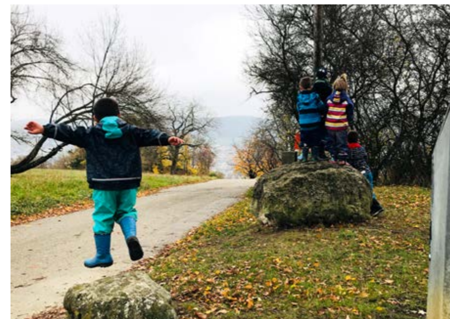
Auf dem Tüllinger Berg gibt es viel zu entdecken

Wie aus den nachstehenden Verwaltungsvorschriften (S. 6) zu erkennen ist, arbeiten Schulleitung, Sonderschullehrkräfte und Mitarbeiter eines Schulkindergartens konzeptionell eng zusammen. Durch die nach dem Umzug des Kindergartens nach Obertüllingen entstandene Nähe konnte diese Zusammenarbeit intensiviert