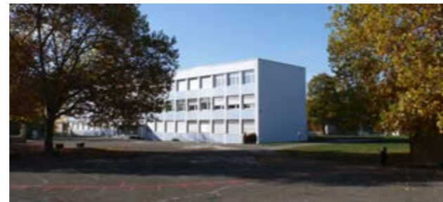
Wohnortnahe inklusive Schulstandorte (z.B. Rheinfeldern)