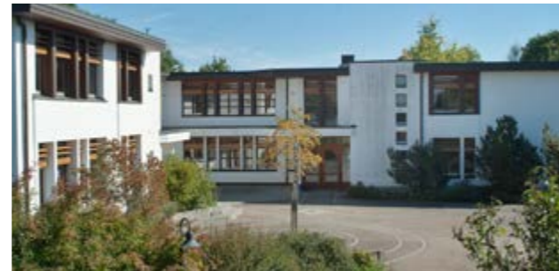
Unsere Schule in Obertüllingen