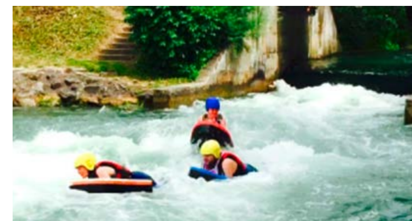
Auch das gehört dazu: Gemeinsamer Ausflug der neuen Mitarbeitenden. Sicherheit und neue Möglichkeiten, ...nicht nur im pädagogischen Wildwasser...

Rückblickend lässt sich sagen, dass das Einarbeitungskonzept und das damit verbundene recht hohe personelle „Investment“ sich nachhaltig lohnen. Zum einen wird in Bewerbungsgesprächen immer wieder deutlich, dass sich Interessenten gerade