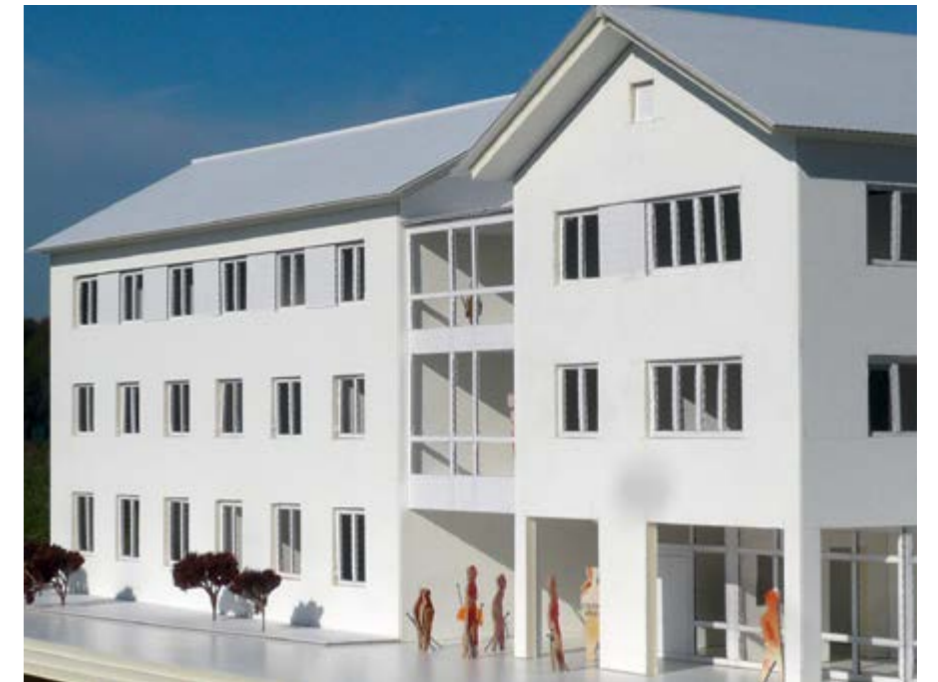
Der Ersatzneubau von Norden gesehen. Der Spielbereich liegt auf der Südseite hinter dem Haus

Die dreigeschossige Bauweise erlaubt eine Gebäudegliederung, die den Bedürfnissen von jungen Menschen mit einem Förderbedarf in der emotionalen und sozialen Entwicklung entgegenkommt: