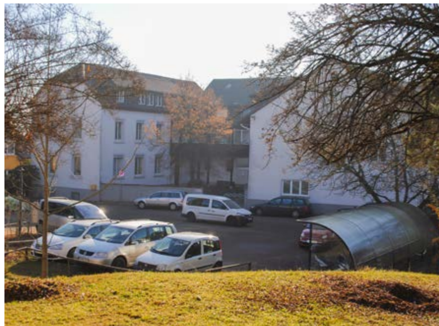
Haus Obertülingen 111 im heutigen Zustand. Der Innenhof ist nach Norden ausgebildet

Das zentral in Obertülingen gelegene ehemalige Heimgebäude, das nun ersetzt werden soll, wurde im Jahr 1860 vom frisch gegründeten Verein ‚Rettungsanstalt Friedrichshöhe‘ erworben und notdürftig hergerichtet, um darin eine Heimstatt für 48 Kinder einzurichten. Bis zum Neubau moderner Wohngruppenhäuser in den 1970er-Jahren bildete das Haus 111 mit Landwirtschaft und Nebengebäuden den Kern des seit den 1930er-Jahren so genannten ‚Evangelischen Kinderheims Tüllinger Höhe‘. Von 1900 an wurde das Haus kontinuierlich vergrößert und technisch angepasst. Es entstand ein Gebäude mit mehreren Anbauten, unterschiedlichen Höhen und unterschiedlichsten Standards, das heute noch zum Teil auf den feuchten Fundamenten und Kellern aus dem 18. Jahrhundert steht.