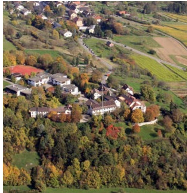
Luftbild der Tüllinger Höhe in Lörrach