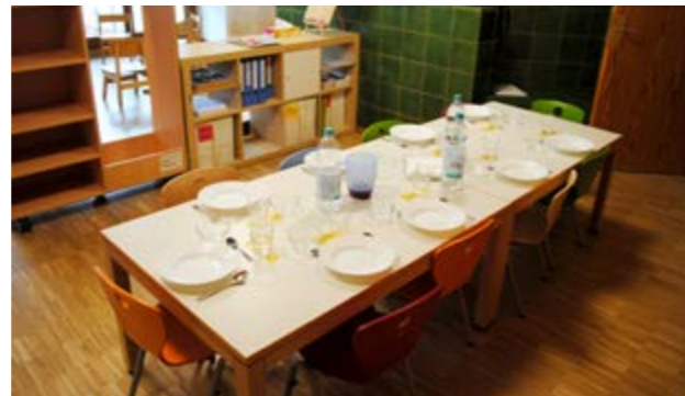
Der Essbereich ist vom Aufenthaltsbereich abgetrennt und kann in Ruhe gerichtet werden

Da es das Wetter in diesem Jahr besonders gut mit uns meint, ist das tägliche Draußen sein ein unbedingtes Muss. Das neue Gelände muss erkundet und kennen gelernt werden, die Menschen auf dem Gelände werden neugierig angesprochen. Bewegung, ‚Fangis‘ oder Ballspiele, Klettern, in den Wald gehen, der Gärtnerin beim Laub rechen helfen, den Pferden Gras ins Gatter werfen – die neuen Möglichkeiten sind so vielfältig, weil Obertüllingen mitten in einer