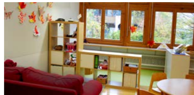
Schulkindergarten Tüllinger Höhe