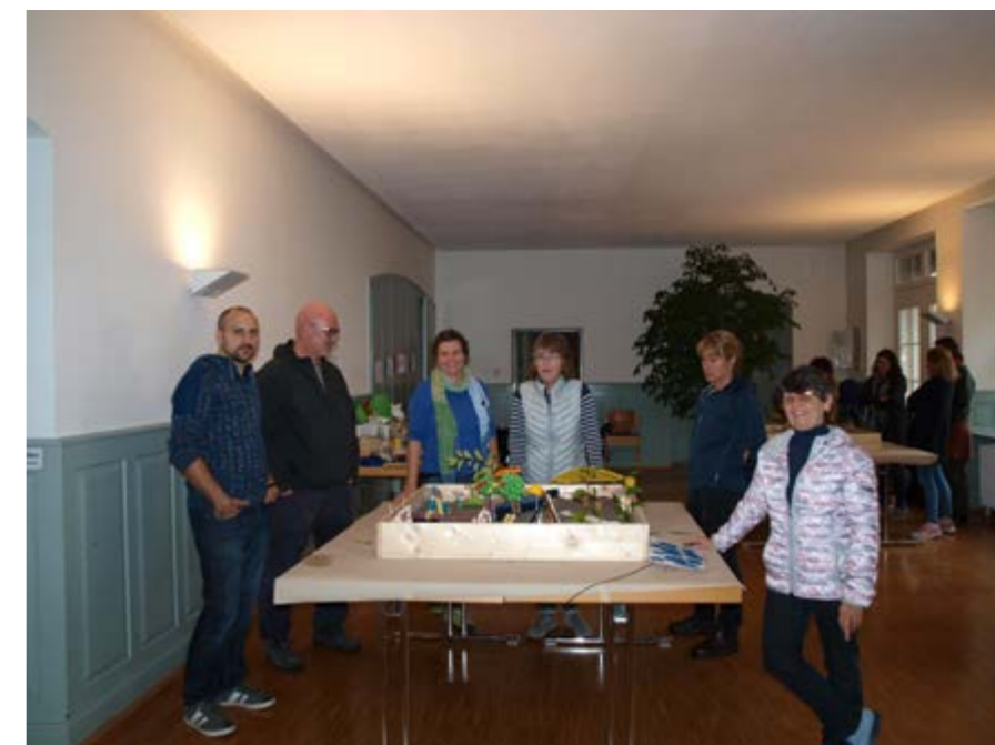
Nach dem Gestaltungsprozess präsentierten die vier Teams ihre Modelle, die später auch dem Architekten vorgestellt wurden