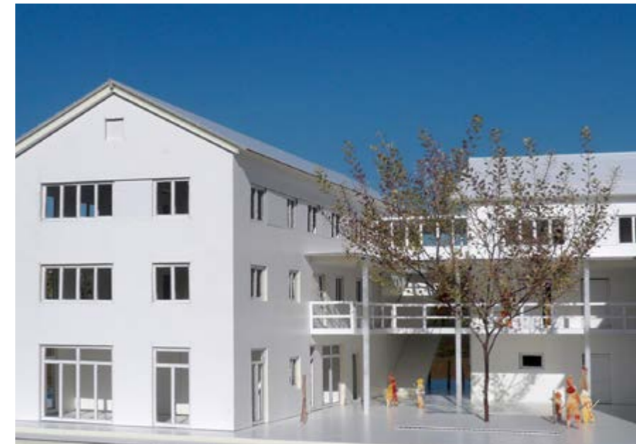
Ansicht von Süden: Der Hof mit Werkstätten und Spielgelände liegt nun geschützt hinter dem Haus und ist auch optisch mit den Tagesgruppenräumen im 1. OG verbunden.

gelungenen Gestaltungselemente aufnehmen und in die architektonische Planung des konkreten Außengeländes einfließen lassen. Darüber hinaus nehmen die Pädagoginnen und Pädagogen die Gestaltungsimpulse auch in die Außenstellen mit, so dass sie auch dort fruchtbar werden können. Überlegt wird noch, wie auch Kinder und ihre Familien in Teilbereiche des Planungs- und Gestaltungsprozess einbezogen werden können.