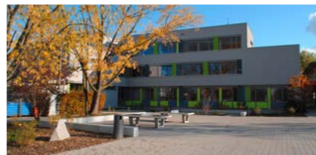
Außenstelle Haltingen (im Gebäude der Hans-Thoma-Schule)