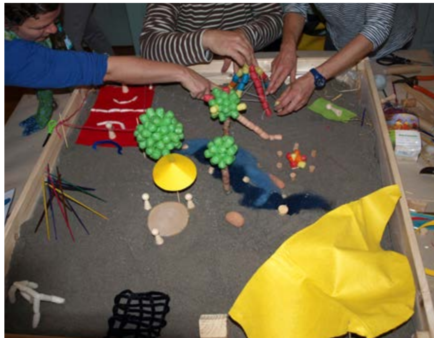
In Teamarbeit wurden Ideen für ein zukünftiges Außengelände entwickelt

Was wird nun mit den erarbeiteten Modellen und Ideen geschehen? Die Planungsgruppe für den Tagesgruppenneubau wird die Grundgedanken und die für unseren Bedarf wichtigen und