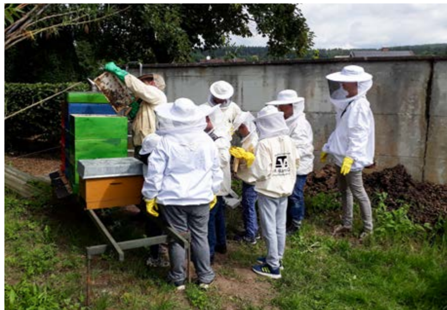
Gut geschützt am Bienenkasten

Die Schüler blicken gespannt auf die seltsamen weißen Anzüge, in die sie schlüpfen sollen. Kurz darauf sind alle bereit, die Bienen aus nächster Nähe zu beobachten.