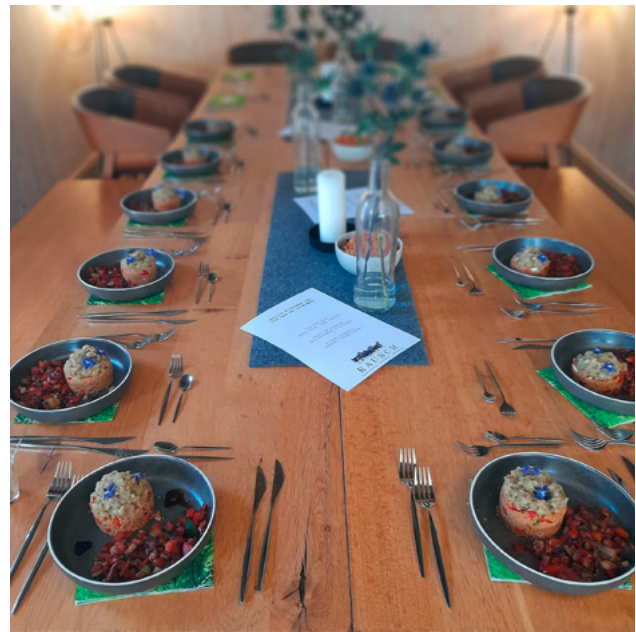
Es ist angerichtet

Und mit gutem Essen ging es am nächsten Tag gleich weiter, und damit ist nicht das Frühstück gemeint. Bereits um 10 Uhr trafen wir uns in der Esswerkstatt Rausch in Schallstadt, um gemeinsam unter fachkundiger Anleitung ein Dreigängemenü zuzubereiten. Wir erhielten dabei manchen guten Tipp rund ums Kochen, lernten neue Lebensmittel kennen, hörten Namen von Gerichten, die uns noch nie untergekommen waren und hatten viel Spaß bei der gemeinsamen Zubereitung der Speisen im schönen Ambiente der neu eingerichteten Lernküche.