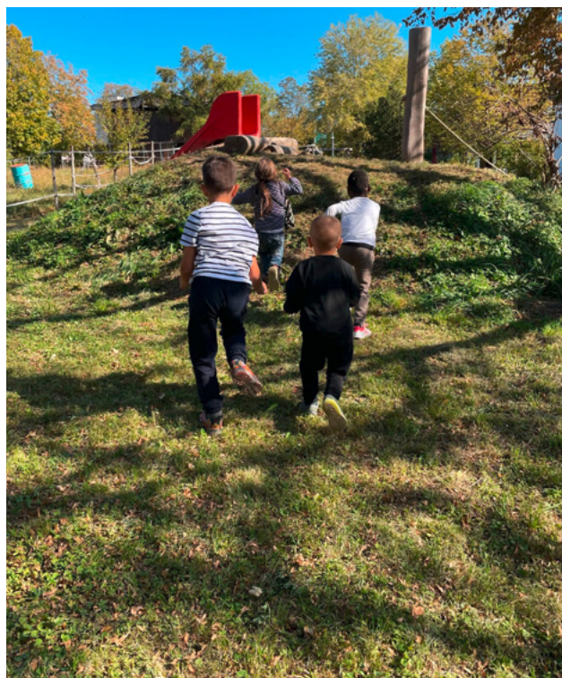
Jetzt geht's los!

Einflussreich bei der Planung war auch das Thema Nachhaltigkeit. So wurden fast ausschließlich nachhaltige Materialien aus der näheren Umgebung und dem Schwarzwald für den Bau verwendet. Der Rasen besteht aus einer Sport- und Wiesenmischung, ist also zum Toben und Spielen geeignet und bietet gleichzeitig heimischen Insekten ein neues zu Hause. Das Gelände wird künftig von insgesamt bis zu 40 Kindern aus allen vier Schulkindergartengruppen genutzt und bietet nun genug Platz, Spielmöglichkeiten und Anregungen, um nach Lust und Laune zu spielen.