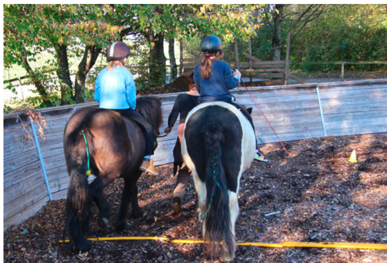
Sich tragen lassen

Und seit Oktober finden nun endlich auch wieder die heilpädagogischen Pferdestunden mit acht Kindern aus unseren Wohngruppen statt. Hier helfen die Kinder ebenfalls bei der Pferdepflege und anderen Arbeiten im Stall und auf der Weide. Vor allem können sie aber, genauso wie es für sie richtig ist, in einen guten Kontakt mit den Pferden treten, deren (natürlicherweise sprachfreie) Signale verstehen lernen, gegenseitiges Vertrauen entwickeln, Beziehung zu ihnen aufbauen und dann auch Reiterfahrten machen.