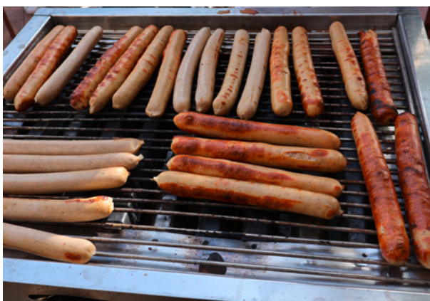
Das macht Appetit und für alle war genug da!

Ein rundum gelungenes Fest bei allerbestem Oktoberwetter!