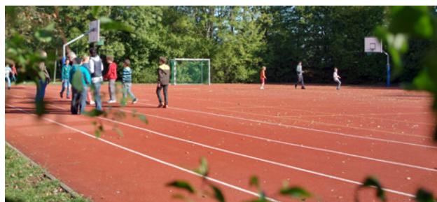
Sportplatz in Obertülingen

SANITÄR · HEIZUNG · BLECH · DACH · FASSADE