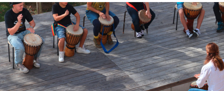
Die Trommelgruppe unserer Schule