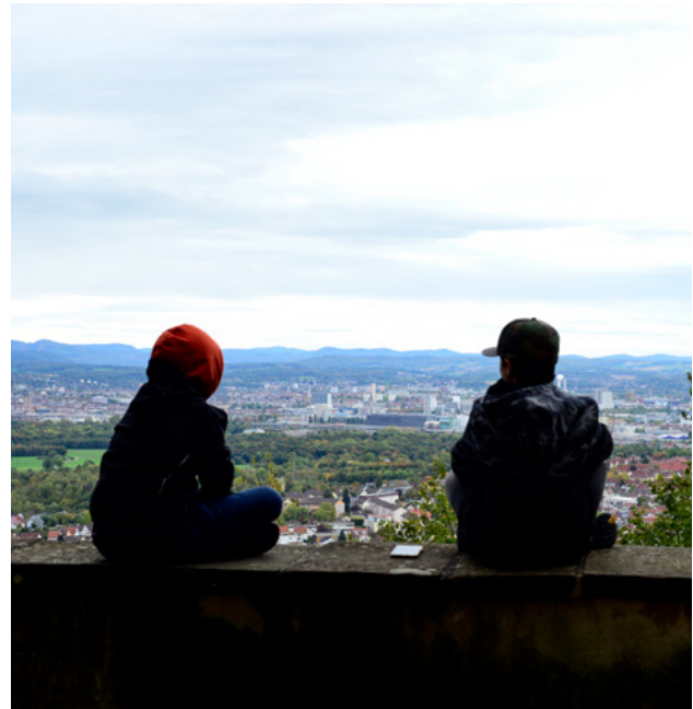
Ausblicke von der Tüllinger Höhe

Unsere Haltung, geprägt von Respekt und Toleranz, Kooperation und Partizipation, Verantwortung und gegenseitiger Wertschätzung ermöglicht tragfähige Beziehungen.