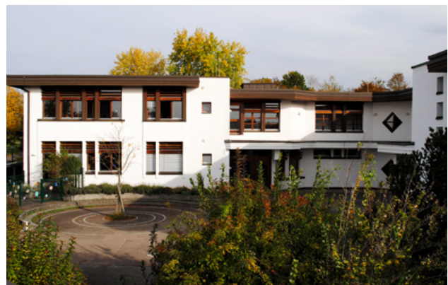
Sonderpädagogisches Bildungs- und Beratungszentrum

Stärken. Lernhemmende Ängste oder Verhaltensmuster können so nach und nach abgelöst werden durch positive sowie selbstwirksame Erfahrungen und neue Perspektiven. Vielfältige emotionale und soziale Förderangebote sollen die Grundlage schaffen für eine Rückführung ins allgemeine Schulsystem oder in eine sich anschließende Berufsausbildung. Unsere Berufsvorbereitung wird insbesondere ab Klasse 7 sehr intensiv verfolgt und beinhaltet neben der Ermittlung der berufsbezogenen Kompetenzen praktischen Unterricht und praktische Handlungsfelder in verschiedenen Bereichen, sowie mehrere Berufspraktika in umliegenden Betrieben.