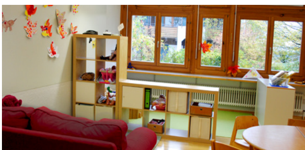
Schulkindergarten Tüllinger Höhe