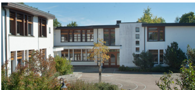
Unsere Schule in Obertülingen