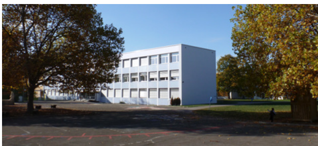
Wohnortnahe inklusive Schulstandorte (z.B. Rheinfelden)